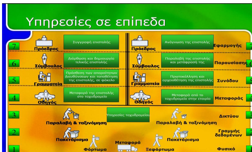
Εικόνα 2: Επικοινωνία προέδρων 2 εταιρειών με στρωματοποίηση